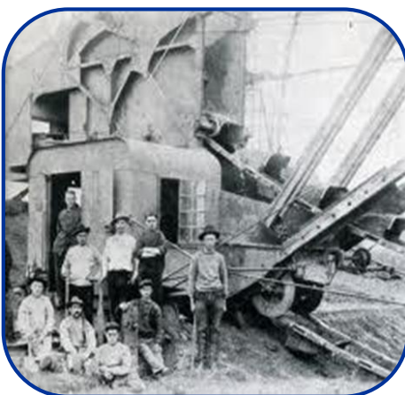
Arbeiders bij “de IJzeren Man”

Deze wagens stonden op een noodspoor om het zand vanuit Vught naar 's-Hertogenbosch te vervoeren. In 's-Hertogenbosch waren mannen van 's morgens vroeg tot het donker werd bezig om deze wagens leeg te halen. Dit deden zij met een schep en een kruitwagen.